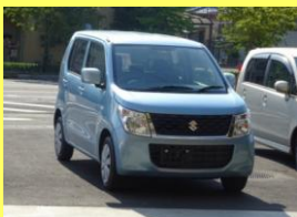
〈先日納車したT様のお車〉 色が気に入られ、ご満足されたご様子でした。ありがとうございました。