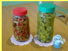
〈H様の漬けられた梅〉 とってもおいしそうでしょう？ これ、男性のお客様が漬けたんです！ きれいな色ですね。